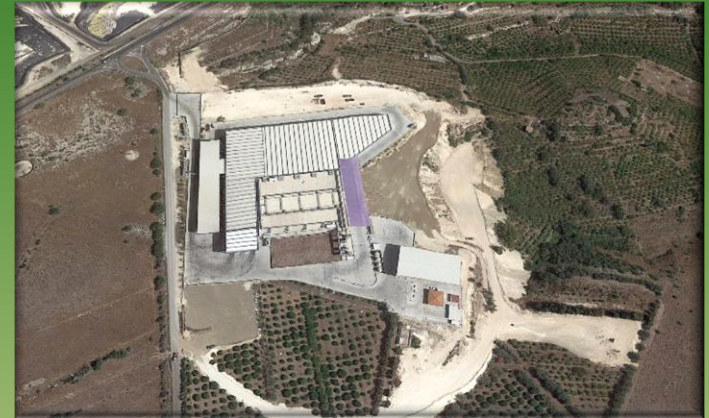
SICULA COMPOST SRL

TRATTAMENTI E SMALTIMENTI DI ALTRI RIFIUTI NON PERICOLOSI