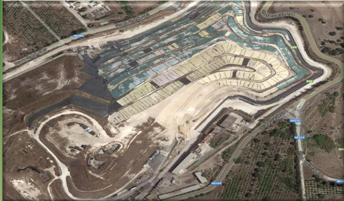
SICULA TRASPORTI SRL ora SPA

TRATTAMENTI E SMALTIMENTI DI ALTRI RIFIUTI NON PERICOLOSI