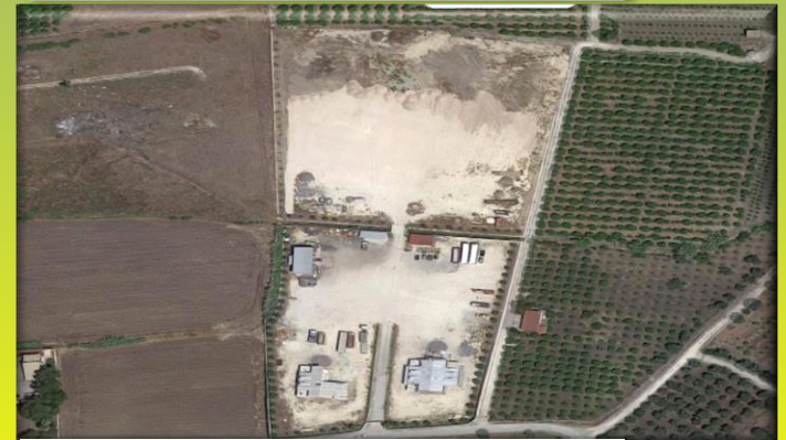
EDILE SUD SRL

ESTRAZIONE DI POMICE E DI ALTRI MINERALI